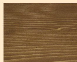
Bangkirai No. 110-85