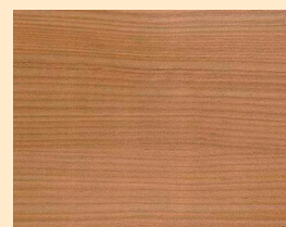
Mélèze No. 110-89