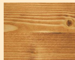
Teck No. 110-81