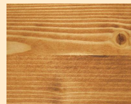
Teck No. 110-81