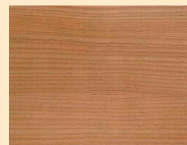
Lärche Nr. 110-89