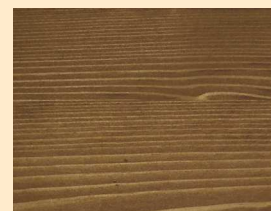
Bangkirai Nr. 110-85