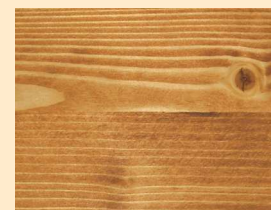
Teak Nr. 110-81