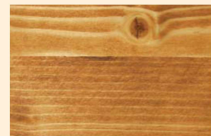
Teaköl Nr. 102-81