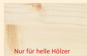
Nur für helle Hölzer