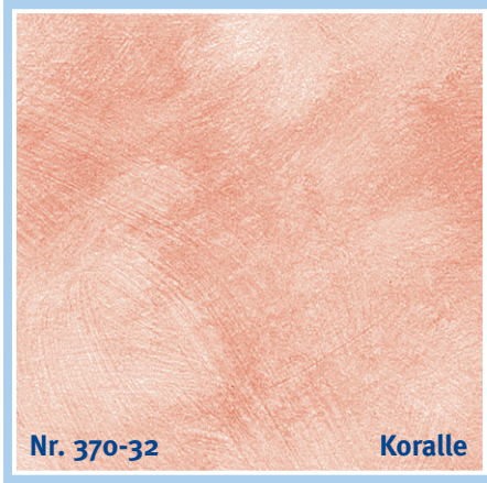
Nr. 370-32 Koralle

maize yellow | jaune mais | maïsgeel | giallo mais | amarillo maíz | κίτρινο καλαμποκιού