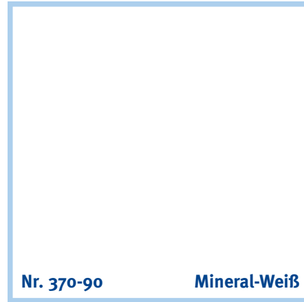
Nr. 370-90 Mineral-Weiß

pistachio | pistache | pistachegroen | pistacchio | pistacho | φουστίκι