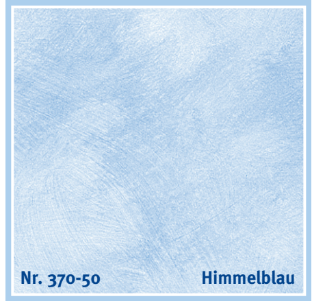
Nr. 370-50 Himmelblau

coral | corail | koraalrood | corallo | coral | κοραλί