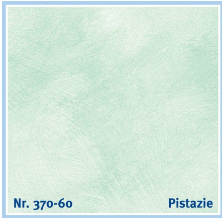
Nr. 370-60 Pistazie

sky blue | bleu ciel | hemelsblauw | celeste | azul cielo | γαλάζιο