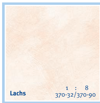
Lachs 1 : 8 370-32/370-90