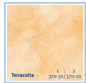
Terracotta 1 : 2 370-32/370-10

Mischungsverhältnis der abgebildeten Farbtöne: 3 Teile Wasser, 1 Teil Farbe | Mixing ratio for the reproduced colour tones: 1 part of paint in 3 parts of water. | Ratio de mélange pour les tons représentés: 3 parts d'eau, 1 part de lasure/cire. | Mengverhouding afgebeelde kleuren: 3 delen water, 1 deel kleur | Rapporto di miscela dei colori riportati: 1 parte di colore, 3 parti di acqua | Proporción de mezcla por los tonos de color reproducidos: 1 parte de color en 3 partes de agua. | Αναλογίες ανάμειξης των απεικονιζόμενων αποχρώσεων: 1 μέρος χρώμα, 3 μέρη νερό.