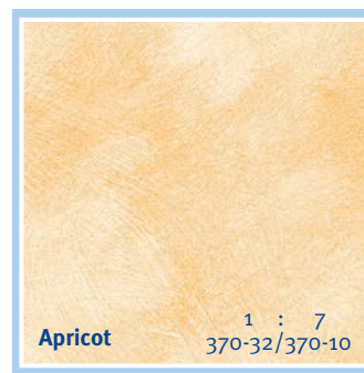
Apricot 1 : 7 370-32/370-10