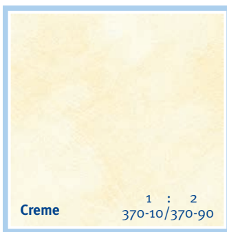
Creme 1 : 2 370-10/370-90