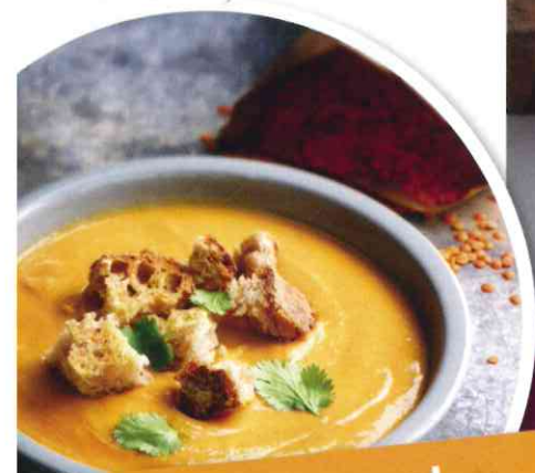
Heiß auf Suppe! Köstliche Rezepte