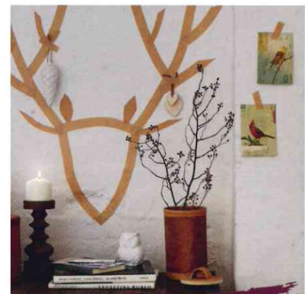
Lichten & Dekorieren: Öfter Waldhütten-Charme