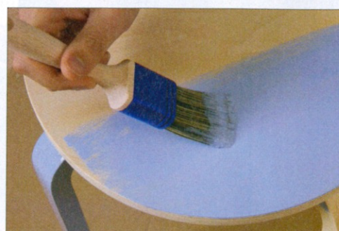
3 Die Farbe lässt sich sehr gut verteilen und ist schnell deckend