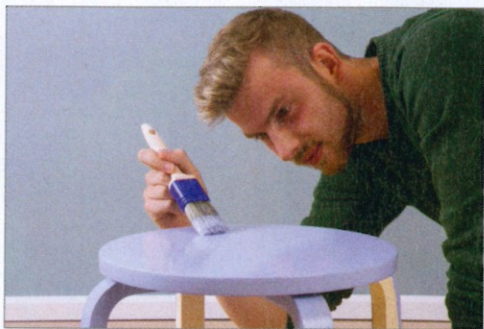
1 Die Farben der Aqua-Serie sind hoch deckend und da sie frei von künstlichen Lösungsmitteln sind, sehr geruchsarm

Farben für Möbel werden zum Beispiel von Auro vertrieben. Ist der Untergrund „tragfähig“, können diese Farben direkt aufgetragen werden. Sie sind auch gut für Kindermöbel geeignet, da sie speichel- und schweißecht sind.