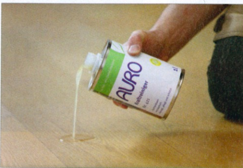
1 Zuerst wird der Reiniger aufgebracht ...

Ist ein Holzboden nach einigen Jahren und vielen Feiern einmal unansehnlich geworden, kann er sehr einfach mit einer Intensivreinigung wieder in Form gebracht werden.