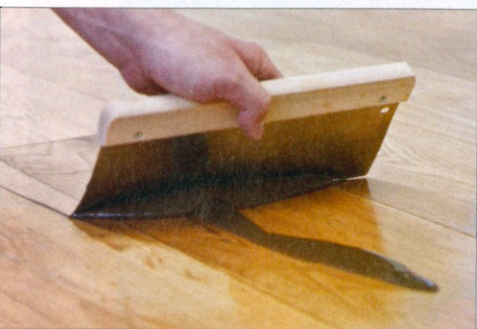
4 Anschließend können die Verschmutzungen mit einem Raker abgenommen werden. Es empfiehlt sich nach einer solchen Grundreinigung noch einmal frisches Öl aufzutragen