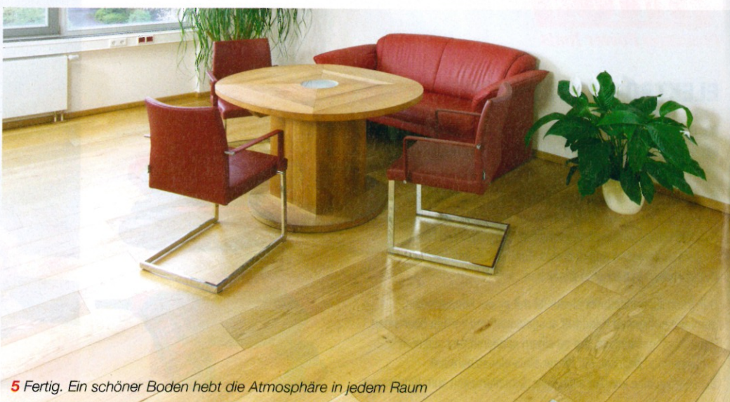
5 Fertig. Ein schöner Boden hebt die Atmosphäre in jedem Raum