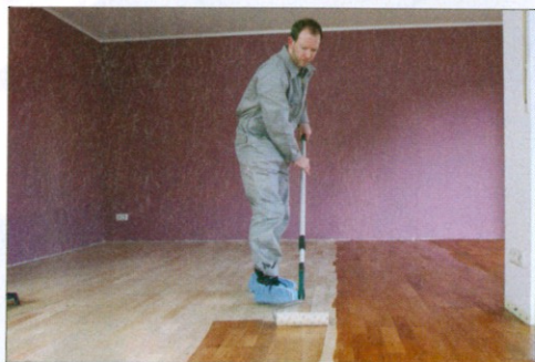
Das Öl wird direkt auf dem Boden verteilt. Überschuss kann mit einem Raker entfernt werden

Die Oberflächenbehandlung von geölten Böden aus Holz und Kork ist denkbar einfach: Das Hartöl mit einer Rolle auf dem Boden verteilen und einwirken lassen. Nach der Behandlung wird das nicht in das Holz eingedrungene Öl mit einem Raker abgenommen und die Holzfläche poliert. Bereits am nächsten Tag kann die seidenmatte Oberfläche wieder benutzt werden. Für eine bessere Oberflächenbeständigkeit sollte ein zweiter Ölauftrag vorgenommen werden.