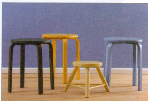
2 Sie sind speichel- und schweißfest, was sie auch für Anwendungen im Kinderzimmer qualifiziert