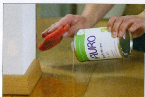
3 An schwer erreichbaren Stellen kann der Reiniger auch mit einem Lappen aufgetragen werden