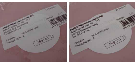
Unsere Farbproben haben wir im Abstand von zwei Wochen an der gleichen Mischmaschine abfüllen lassen

+ über das Internet bestellbar / wiederholbare Farbtöne