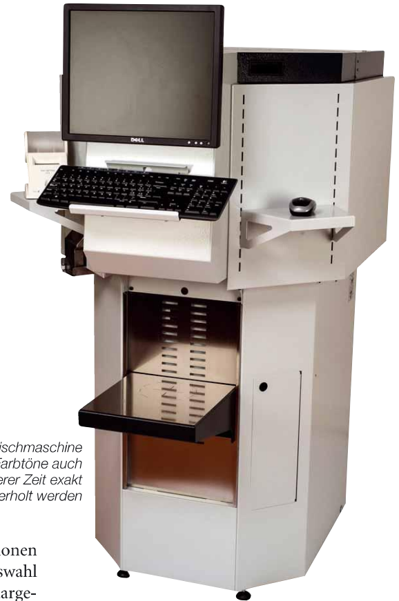
Mit dieser Mischmaschine können die Farbtöne auch nach längerer Zeit exakt wiederholt werden

Wer sich bei der Wandfarbe einen individuellen Farbton anmischen lässt, sollte immer darauf achten, dass er auch genug Farbe bestellt, denn oft treffen Nachmischungen den vorherigen Farbton nur ungenau. Auro hat dieses Problem mit seiner neuen Serie Colours for Life gelöst.